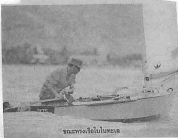
ขณะทรงเรือใบในทะเล