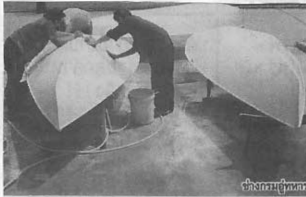
ช่างกรรมอยู่ทากรเรือขณะซ่อมทำตัวเรือ