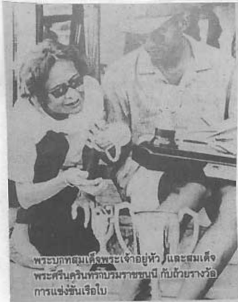
พระบาทสมเด็จพระเจ้าอยู่หัว และสมเด็จพระศรีนครินทราบรมราชชนนี กับด้วยรางวัลการแข่งขันเรือใบ