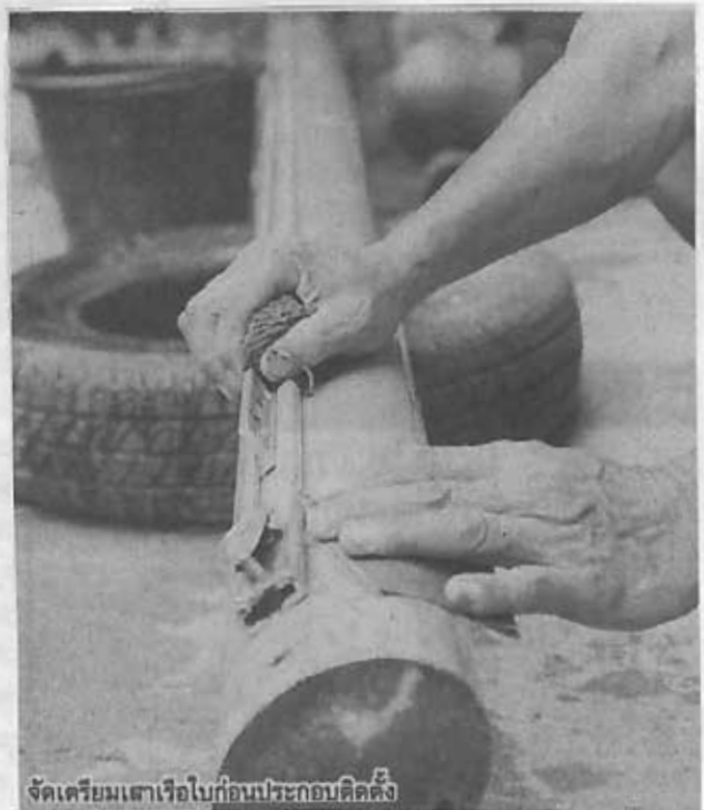
จัดเตรียมเสาเรือใบก่อนประกอบติดตั้ง