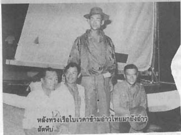
หลังทรงเรือใบเวทากัมฮาวไทยมายังฮาว ฮัดสัน