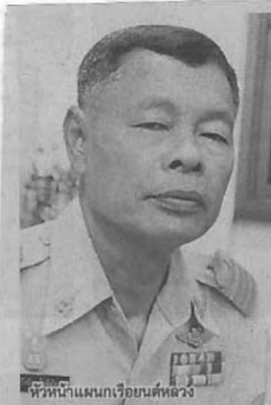
หัวหน้าแผนกเรือยนต์หลวง