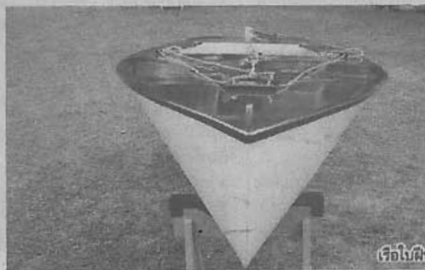
เรือใบฝีพระหัตถ์ AX1